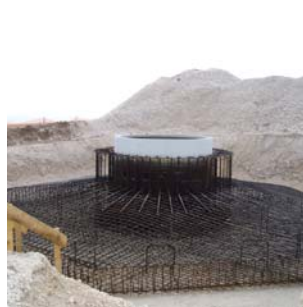
Ferrailage du massif : jusqu'à 24t d'acier