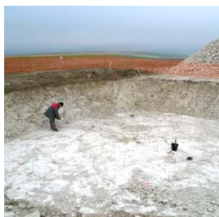
Tracage des repères du massif de fondation