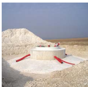
Fondation terminée: jusqu'à 200 m³ de béton