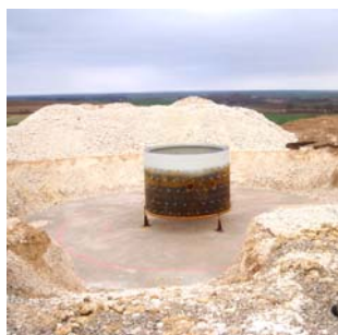
Préparation de la virole sur le béton d'étanchéité