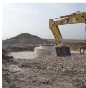
Remblaiement de la fondation