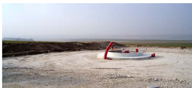
Fondation terminée et remblayée, prête à recevoir l'éolienne.

Le montage des 19 éoliennes du site éolien de l'Argonne a commencé le 12 avril. Celui du site des Côtes de Champagne devrait débuter vers le 16 mai. Impressionnants et atypiques, ces travaux risquent d'attirer de nombreux curieux. Des dispositions adéquates seront prises pour assurer la sécurité du public pendant tout l'évènement.